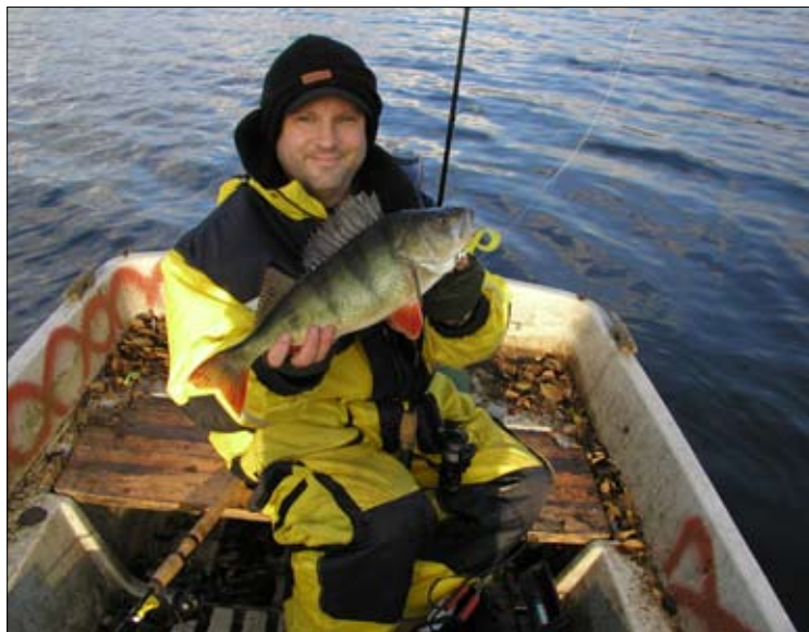
Årets sista höstaborre var riktigt fin, högg djupt och stretade emot ordentligt.

ökar dina chanser betydligt. Strax efter badet svänger sjön kraftigt mot norr och en lång vass breder ut sig. På hösten verkar det som små stim av lite större abborre "patrullerar" längs denna vass. Ibland finns de nära kröken mot badet och huggen är inte sällan rejäla. Har värmen lockat upp abborren så bör du försöka att fiska ganska nära vassen, dock finns det mycket vattenväxter som naturligtvis fastnar i betet. Jag brukar justera farten om jag sitter i en båt alternativt veva fortare vid spinnfiske för att få betet att gå högre i vattnet. Detta är att föredra mot att tex byta ut betet som man vet är effektivt och som man tror på. Många fiskar inte på sådana här platser, det är för krångligt helt enkelt, var glad för det, mer fisk till den som står ut med lite sjögräs på kroken. När du nått fram till djupudden så är det som vanligt högintressant. Bergsknallarna längst ut på udden har gett ifrån sig flera fina kilosbitar. Här är det mycket djupt, uppemot en tretton fjorton meter. Ut med betet, låt det sjunka ordentligt,