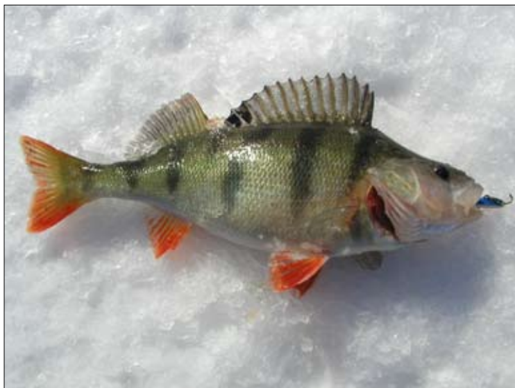
En stor har nappar på den klassiska balanspirken.