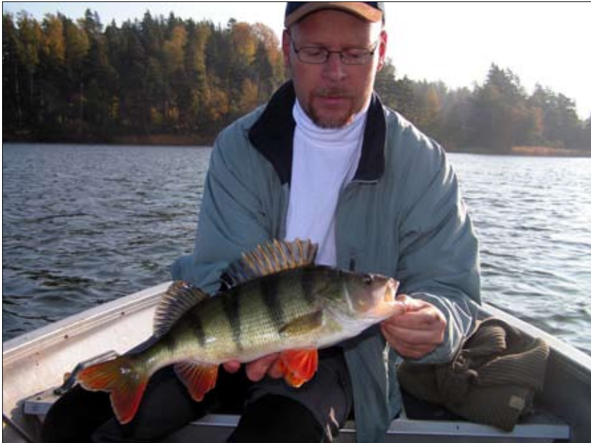
Jiggfiske på grynnan kan vara så här givande.

I Mälaren har klubben sedan länge en liten båtklubb vackert belägen vid fiskartorp, inte långt från Bro Gård. Umgänget och arbetet runt den lilla hamnen präglas av gemyt och ett och annat skratt. Båtklubben är en träffpunkt för medlemmarna och härifrån har många gädd- och gösexpeditioner utgått. Här gäller verkligen regeln om att gräset är grönnare... Många tar båten långa sträckor för att fiska när det finns flera riktigt heta ställen bara ett stenkast från hamnen. Både Kvarnbotten och Bastugrynnan är giftiga ställen, inte långt bort alls. En liten introduktion till några av de finaste platserna måste nästan med för att denna skrift skall bli fullständig.