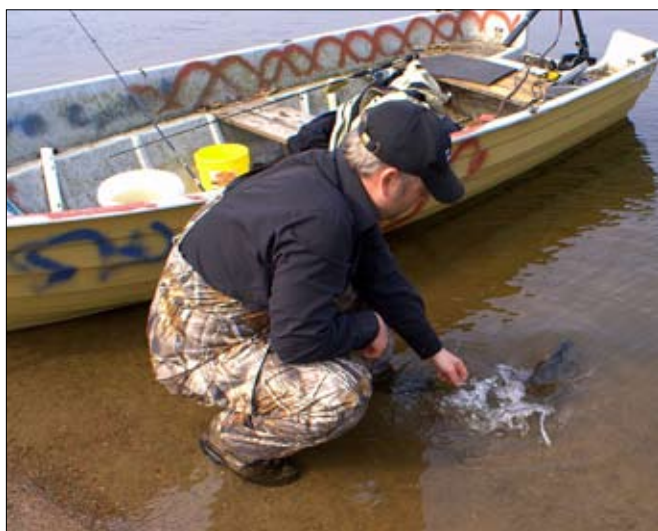
Stor fisk går alltid tillbaka med orden "Hämta Farfar".

Om du sitter i en båt så kan en liten wobbler med inte alltför kraftig och vibrerande gång också vara bra. I ärlighetens namn skall sägas att wobbler av andra än mig, hålls väldigt högt som höstbete för abborren. Är du mete intresserad gör du som tidigare presenterats dvs som Linus Johansson, fångar småmört och tacklar med en åttans trekrok under ett flöte och på detta metar du sedan den stora höstabborren.