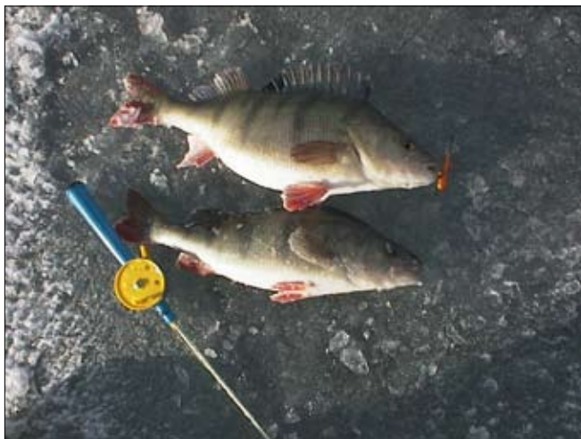
Styvt spö med flätlina och balanspirk underlättar.

Något som näst intill har revolutionerat fisket efter abborre på lite större djup är de nya stumma super/ flät-linorna. Jag använder numera ingen annan lina än denna för abborren. Dock har jag skärvat en meter lång tafs av vanlig nylon i 0,25 mm grovlek som spets, mest för att jag tror att den syns mindre i vattnet än den flätade linan. Med dessa stumma linor får man en rent fantastisk kontakt med pirken även på de riktigt djupa vattnen. Inte alla dessa superlinor lämpar sig dock. Flera kan bli ohanterliga när det är minusgrader och linan blivit våt. Då krånglar de rejält och fryser gärna