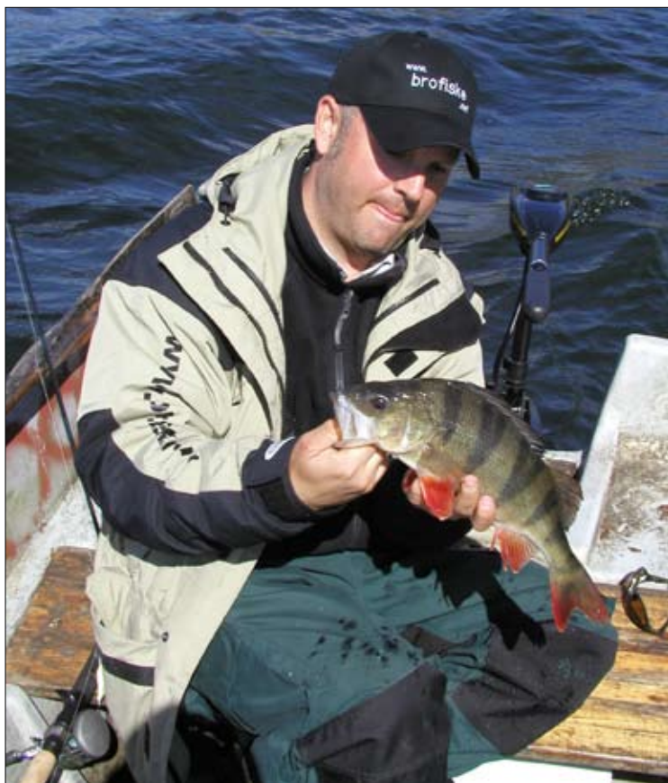
Vårabborren är ofta stor men kräver tid för att nappa.

här tidigt ge utdelning. Har du tillgång till båt så skall du absolut försöka på dina favoritställen på vintern och pimpla som vanligt. Detta kan vara mycket effektivt under den allra första isfria tiden. Trots detta är det kanske framför allt fisket med spö o rulle som nu tar sin början för säsongen. Den viktigaste regeln nu är att låta betet fiska så nära botten som möjligt. Abborren verkar nästan cementerad vid denna och kan vara helt omöjlig att lura till hugg någon annanstans. I fiskelitteraturen kan man läsa att abborrens