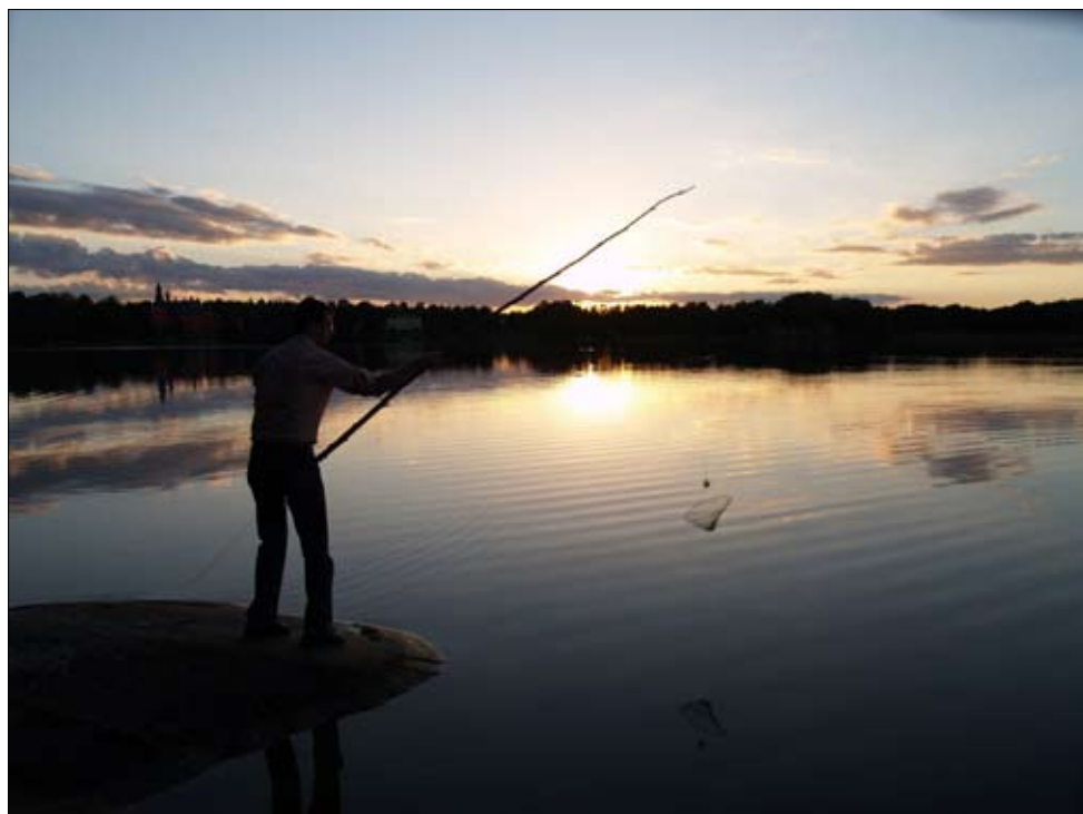
Kräfhåven gungas ut, kvällen kommer och med den kräftorna.

Börja kvällen med djupfiske. Använd en lång slana till att ”gunga” ut kräfhåvarna i vattnet. Välj ut de ställen där det ser ut