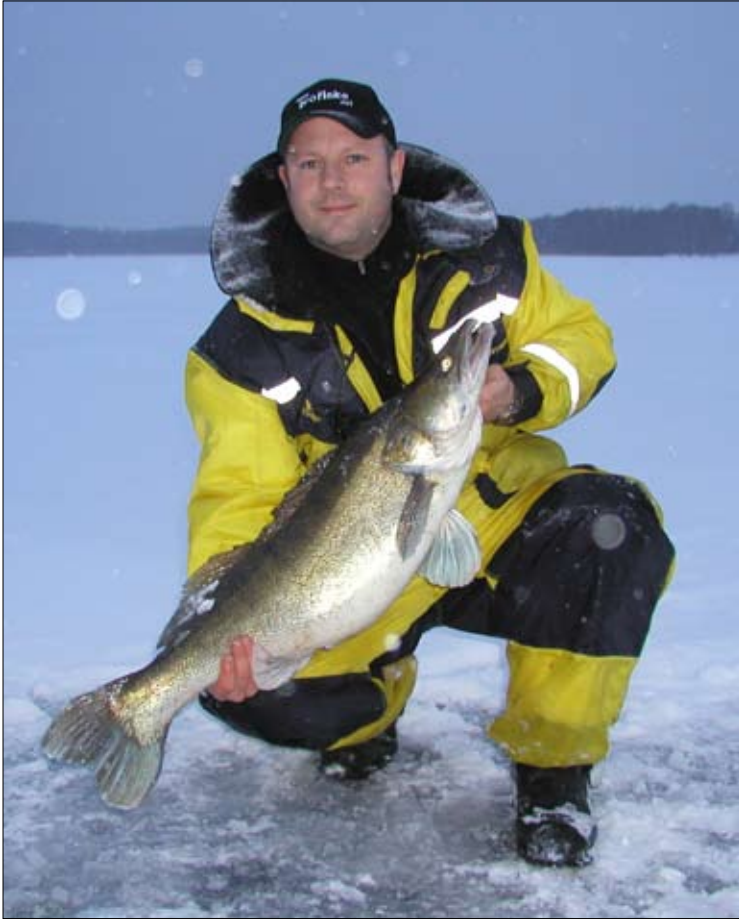
Inte från Lejondal men så kommer de att se ut om några år, drygt åtta kilo.

fisken rör på sig igen. De som är riktigt avancerade påstås kunna få gösen att svälja betet genom att lirka lite försiktigt i linan. Ett bra tips är att fylla hålen med slask. Gösen skyggar ofta för hålen pga sin ljuskänslighet. Gösens ögon är specialgjorda för jakt i dåligt ljus, glöm inte det.