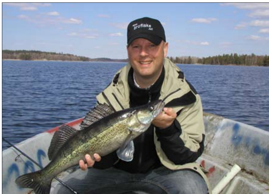
Den första fångade gösen i Lejondal under 2000: talet, på gul jigg förstås.

tänka tanken klart för än det var dags igen! Ett av spöna darrade till och la sig makligt bakåt, typiskt för göshugg. Jag har alltid trott att gösen är en modig fisk, inte ens när den tvingas till båtkanten gör den speciellt mycket väsen av sig. Den tittar lite lojt på fiskaren med attityden ”mig tar du aldrig”. Tyvärr så är ju detta i så fall en grov missbedömning från fiskens sida ... Tro det eller ej men så fortsatte fisket den kvällen. De närmaste två timmarna fick vi femton gösar, tyvärr var flera på tok för små och fick gå tillbaka men vad gjorde det. Vi turades om att borda fiskarna i demokratisk ordning och kände oss på alla sätt tillfreds med vårt fiskeliv. En vacker kväll när fisken biter som tokig kan få saker slå. En ny fiskekompis hade jag också fått, försedd med ett lyckligt leende.