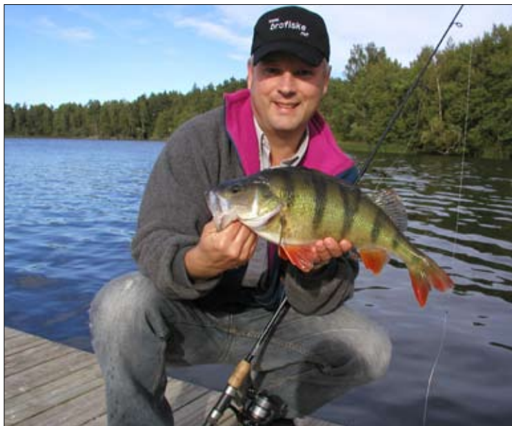
Vilken sjö och vilka fiskar! Glädjen över en stor och vacker fisk är sann.