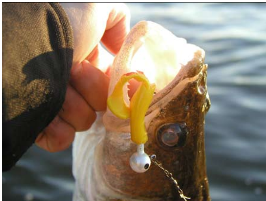
Även gösen hittas på Mälargrynnorna, jiggad fisk på fyra kilo.

Ett stort stenparti som namnet antyder. Du hittar den lätt på kartan, mellan båtklubben Arken och ön Fläsklösa. Även denna grynna är relativt stor och är en av de få som markeras av ett parti som sticker upp över vattnet. Därför är den också lätt att hitta. Här finns det gott om gädda, abborrfisket på höstarna som tillhör ett av årets höjdpunkter är ofta väldigt bra just på denna grynna. Runt Storgrynnans branter kan det löna sig att sommartrolla efter gösen, här måste du dock ha annat fiskekort då du passerat gränsen för fiskeklubbens vatten. Jo, var försiktig inne på grundpartiet. Minst två stora stenar ligger illa till och är dödliga för propellern om du har otur.