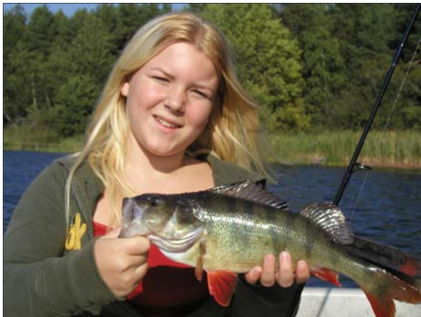
En vacker augustifisk, fångad mitt på dagen.

rar. Annars tycker jag att hösten är den tid på året när abborrharna kan få för sig att hugga lite när som helst, vilket kan vara nog så frustrerande.