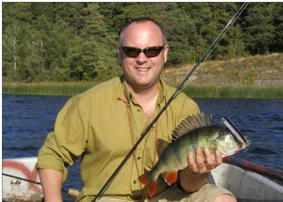
Spoken är sommarens favorit för stor fisk.

gen med att klia mig i huvudet på ett myggbett. Det är att jämföra med torrflugfiske efter storöring, när det är som bäst... Något som skiljer ytbetesfisket från andra fiskesätt är dess förmåga att verkligen locka fisken till hugg. Är fisket lite halvdant kan det vara värt att nöta en bra stund på en begränsad yta. Rätt som det är verkar abborren ”tröttna” på den skvalpande och högljudda Spoken och bestämmer sig för att bita... Ofta väger fisken över ett halvt kilo ska tilläggas. Det är värt att nämnas att förutom Spookarna så finns det en uppsjö av andra beten för ytfiske, poppers mfl. Självklart ska man prova sig fram till sin egen favorit som med allt annat fiske. Bara det är ju jättekul, att prova olika beten.