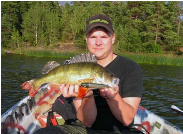
Kryssande ytbyte, sommarabborren misstag den för en mört

En perfekt sträcka att släpa ett bete efter båten. Går du från land så finns det här många bra ställen att välja på. Var uppmärksam efter de luckor som finns i vassen på flera ställen. Dessa luckor verkar