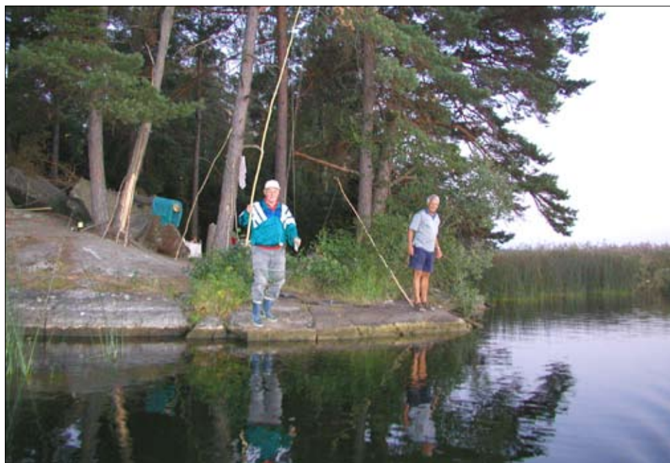
Härliga kräftkvällar för kommunens invånare.

Det är svårt att skriva om Lejondal utan att ha med några rader om det berömda kräftfisket. Den uppmärksamme läsaren har säkert redan noterat att dessa kräftor betytt mycket för intresset för sjön. Kräftorna fungerar uppenbarligen som turboföda för speciellt abborren under vissa perioder. Även gäddan kan ibland få för sig att hugga in på dessa läckerheter. Jag har räknat till inte mindre än fyra kräftor i magen på en liten gädda jag fångade för några år