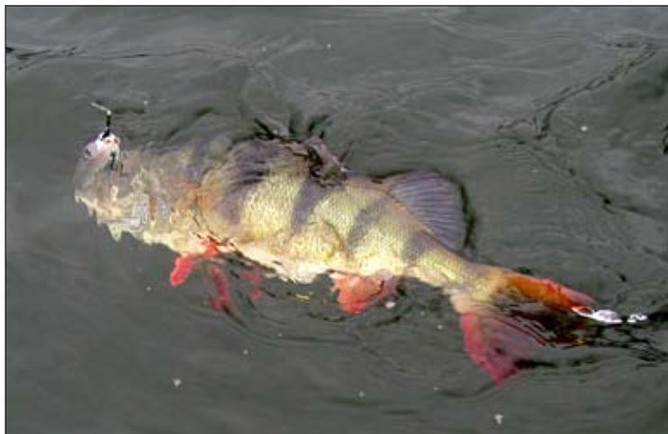
Spoken har återigen lurat en av de stora, ibland är det enkelt ...

känslan, designat av gode vännen Andreas "Push-Up" Dybedahl. På rullen sitter det stum flätlina. Om jag inte nämnt det tidigare så använder jag enbart dessa linor idag.