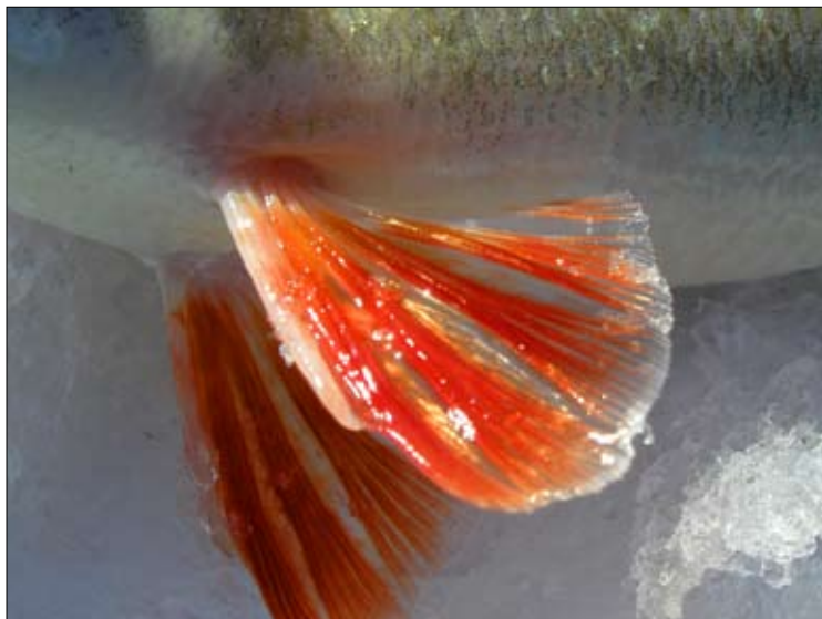
Stor med röda fenor, ett smycke mot snön.

En regel som jag tycker man kan tillåta sig är att sätta tillbaka fisk man ej tänker äta. Ett personligt rekord kan vara trevligt att behålla men att föreviga en sådan fisk med kamera räcker gott och väl åtminstone för mig själv.