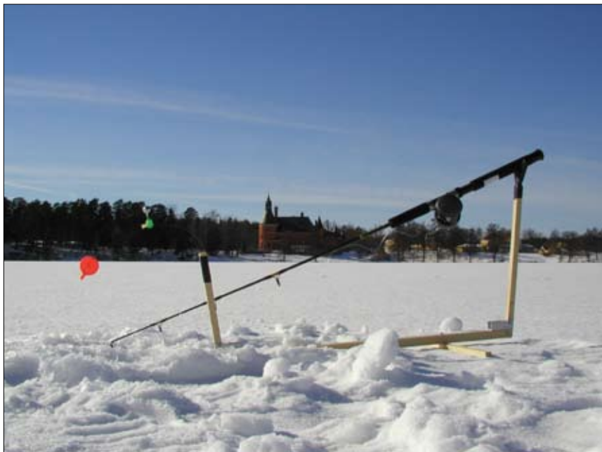
Hållger förenklar ditt ismete, skaffa en nu!