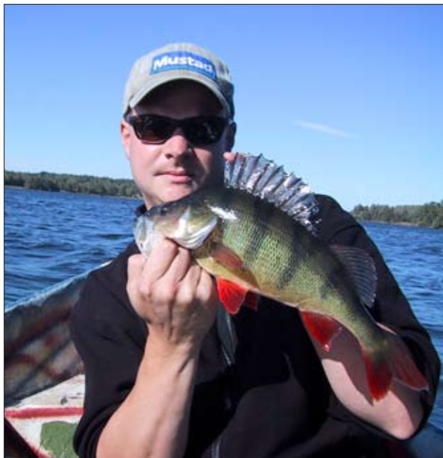
Ormsundet är ett klassiskt vatten för pimplaren men är lika bra på sommaren.

Fisket kan vara givande i stort sett var som helst, ett tips dock, sätt tillbaka fisk som inte har lekt. Det är god fiskevård, fast nu är jag kanske lite tjugig. Kring några av dessa vikar finns fågelskyddsområden. Du måste själv informera dig om reglerna för dessa så att du inte bryter mot lagar och förordningar. Info finns bl.a. på kommunen.