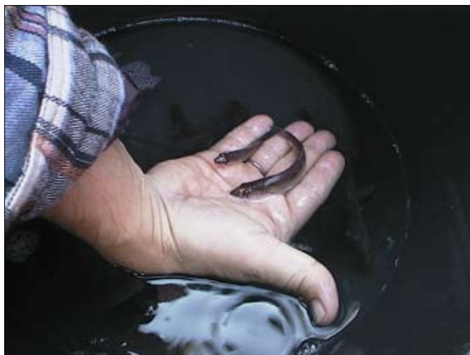
Dessa yngel är snart stora, vackra gösar som ska fiskas ljumna augustikvällar.

På tal om utsättningar, inom de närmaste åren kan vi hur som helst hoppas på en förbättring av gösstatistiken. Under de tre senaste åren har ca 14.000 gösungar planterats ut. Detta har skett i regi av Bro Sportfiskeklubb samt I1:s fiskeförening. Gösarna har varit i snitt tio cm långa och odlats från vår till sensommar. Tyvärr finns det inte större fisk att tillgå. Gösen växer ca tio cm per år och man räknar med att den är könsmogen efter ca fyra år och väger då lite drygt ett kilo. Trots sin litenhet vid utplanteringen räknar man generellt med att ca åttio procent av fisken klarar sig. Dessa resterande fiskar kan förhoppningsvis nå lekmogen ålder och bidra till att beståndet blir stort och livskraftigt. Med detta kommer fisket kanske att bli ännu mer intressant och roligt. De första fiskarna har nu sakta börjat visa intresse för konstgjorda beten. Under 2005 har de första vackra gösarna fångats. Att de har trivts i sjön och levt som prinsar bekräftas av att det varit mycket välmående och feta... Jag hade själv förmånen att fånga kanske den första sportfiskefångade gösen i modern tid. En underbart vacker hane, togs på den obligatoriska gula jiggen en av de sista dagarna i april 2005,