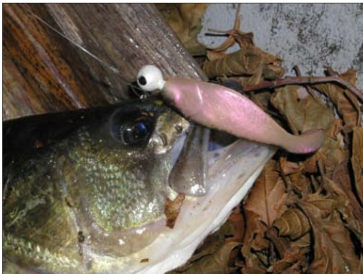
Jigg är kanske det effektivaste betet för abborren.

mot den följande viken. Från just denna stenhäll fick en herre från Bålsta en vacker fisk på ca två kilo, dessförinnan hade han också vunnit en massa pengar på lotteri undrar vad han hade för knep mån tro. Detta skedde någon gång på tidigt nittiotal. Bottnarna är här väldigt intressanta. Utanför mitten på udden är det rejält djupt med en brant upp mot stranden. Här kan drömabborren få för sig att nappa, inte tvivel om det. Bara några meter längre bort kommer du till ett flak med lite jämnare botten, du är då mitt emot vassen. Här har jag aldrig fått någon riktigt stor men räknar det till en av de säkraste platserna i sjön för abborre runt två till tre hekto. Dessa abborrar ger god sport.