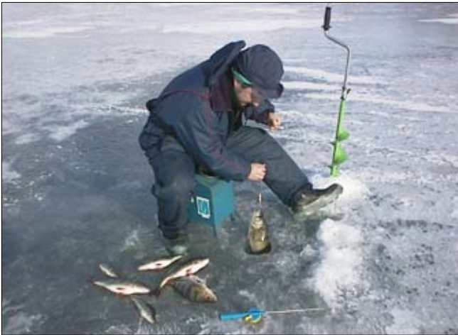
De första kontakterna med Storabborren var härliga.