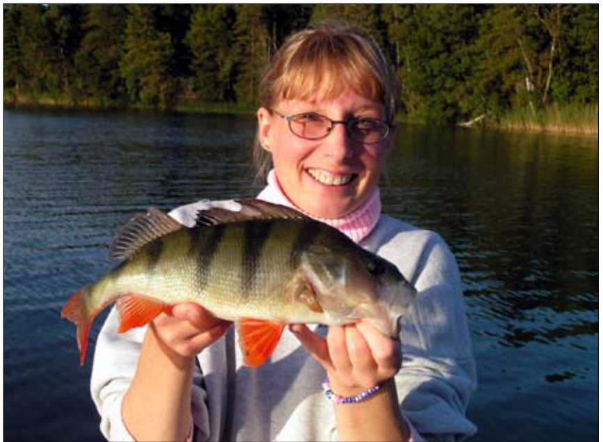
Höstabborre, åter fet och välmående efter vårens ansträngande lek.

Jag hade gått efter stranden och fiskat mig ända ut på djupudd- den. En härlig promenad som för det mesta brukar ge en o annan matabbore. Bergen mellan badet och djupudden är härliga fiske- platser, steniga bottenar med kräftor som lockar storabborren, dock inte denna dag. Vi fiskare brukar ju säga "det gör inget, det var ju en härlig tur" men visst sjutton är det lite trist när inte fisken vill