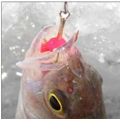
Blänket lockar och abborren biter.

isen dolde de berg- och stentoppar som brukar sticka upp och ange läget.