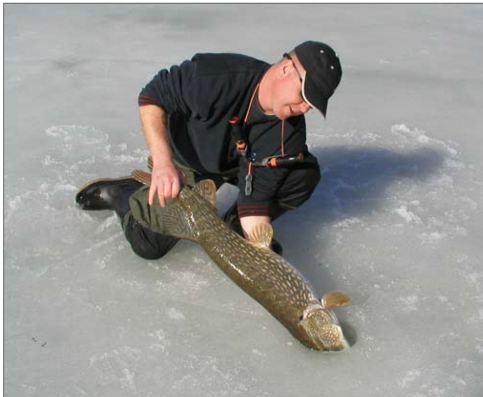
Stor gädda sätts tillbaka efter lyckat ismete.

gäller hållfasthet. Det valet får man göra själv. Ett annat kul tips är att på angelrullen fästa en tejpbit eller måla en markering med färg. När man befinner sig en bit från donet som just fällt vippan kan man på ett bättre sätt se om spolen roterar, dvs om fiske drar ut lina. På de normalt enfärgade spolarna är detta annars svårt att se. Personligen tycker jag att det förhöjer spänningen att på långt håll kunna se hur spolen roterar för fullt och man kan vara ganska säker på att det då inte är ett så kallat blindfäll.