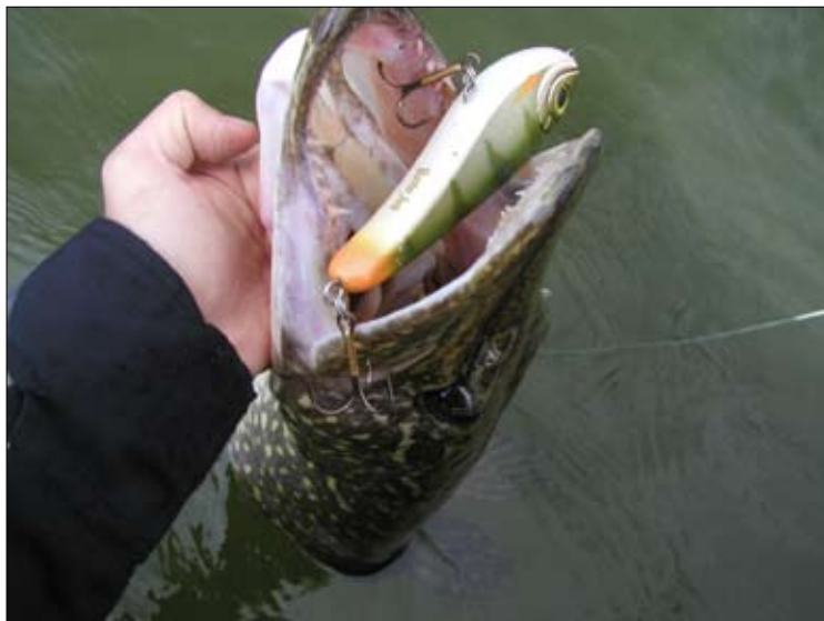
En glupsk vårgädda har tagit jerkbaiten, snabbt tillbaka för att fortsätta leken.

levande mört som bete och har haft framgång med detta framför allt i Mälaren. Samma sak borde gå att praktisera även på Lejondals-sjön. Att ro eller trolla ett levande bete, sk flötestrolling är också det något att tänka på.