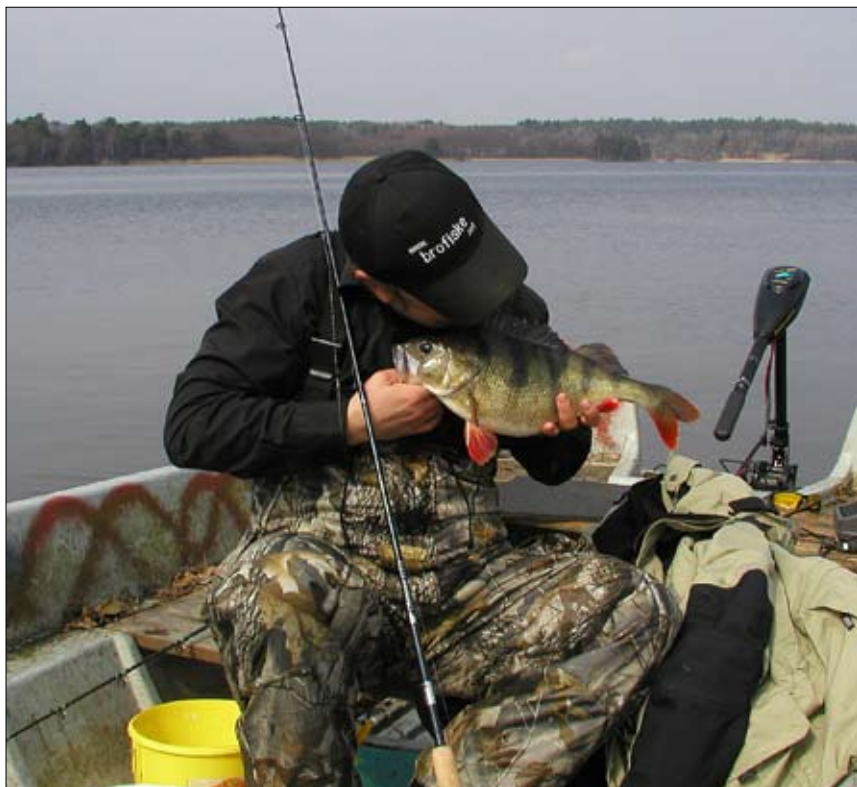
En av sjöns bjässar har nappat, full med rom och vacker som bara en vårabborre kan vara.

Under ens fiskeliv utvecklas det ett sjätte sinne. Förmågan att få fisk när inte andra får det, förmågan att läsa ett vatten och gå direkt på ett fångstgivande ställe. Välja ett attraktivt bete som tilltalar fisken man riktar sig till... Allt detta i kombination med koncentration och absolut koll på linan, hela tiden, gör att man så småningom blir en bättre sportfiskare. Det jag vill säga är att ett sjätte fiskesinne inte är något man föds med utan något man förvärvar genom att aktivt fiska och analysera sitt fiske. Ett typexempel på det är när en god vän frågade mig om mitt jiggfiske ”hur gör du egentligen, jag