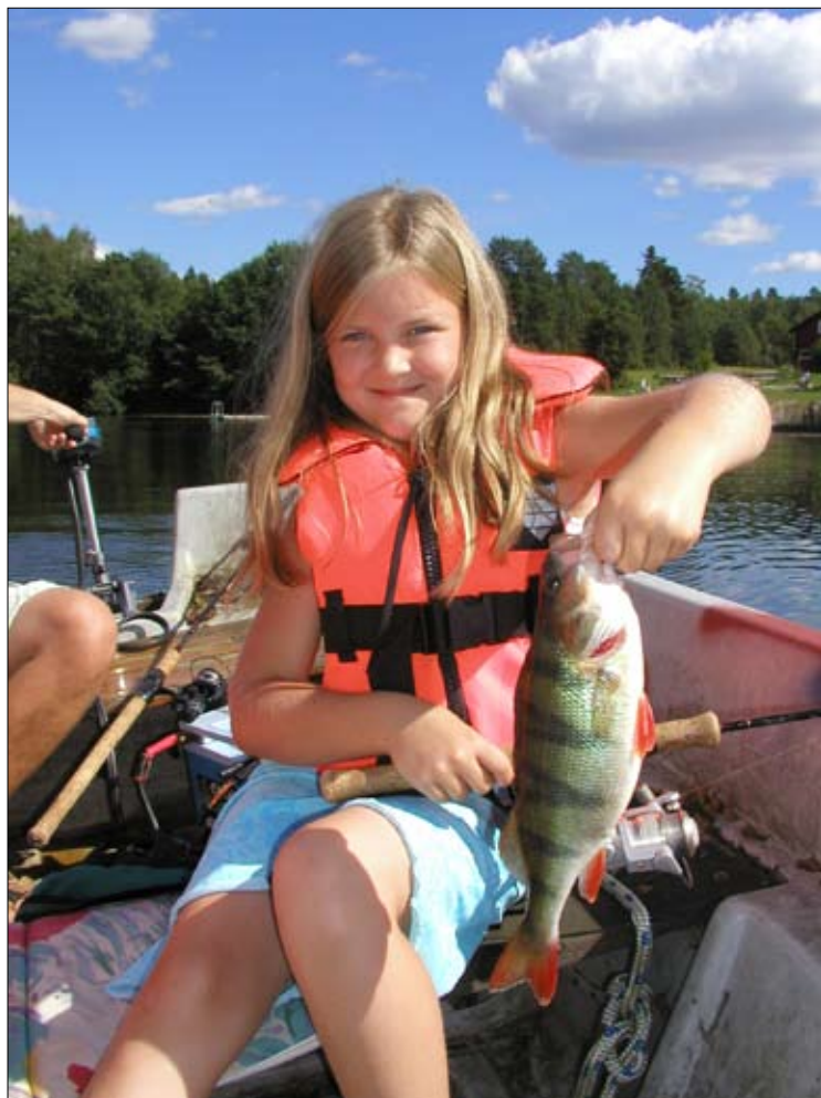
Fisket är härligt i varmt väder, abborren trivs.

och vi har förstått att denna man är en hejare på abborre, förmodligen helt oavsiktligt då han egentligen är ute efter gädda. Han fiskar alltid med en flöttacklad mört och emellanåt lyckas han få riktiga monsterabborrar. Jag har själv inte metat med levande agn